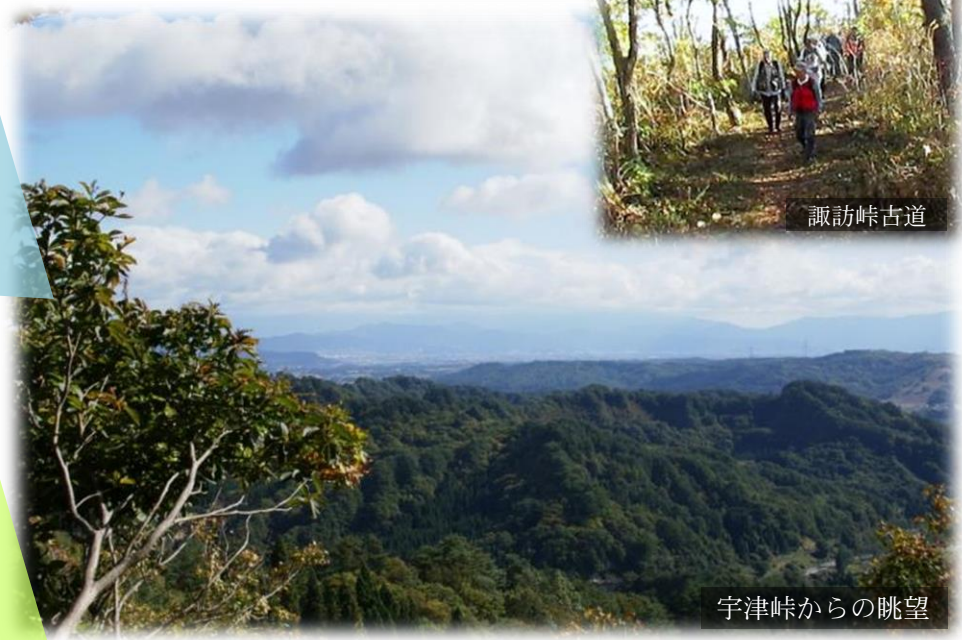
宇津峠からの眺望